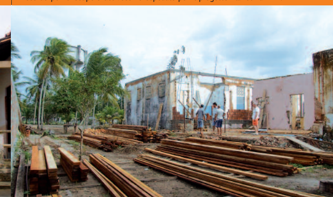
Aprile 2009. Inizio dei lavori di ricostruzione.