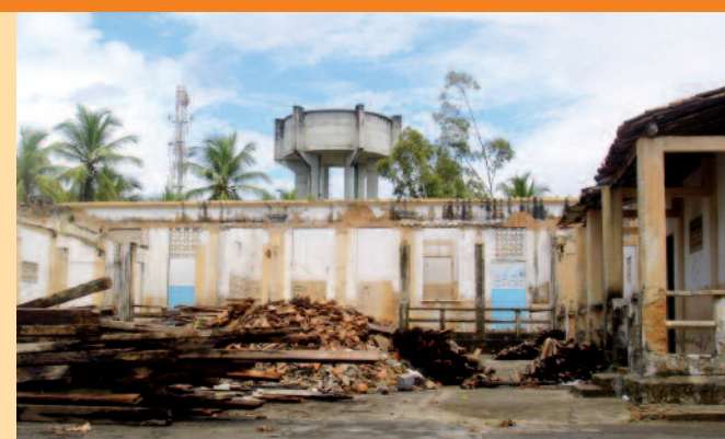
Marzo 2009. Lavori di demolizione.