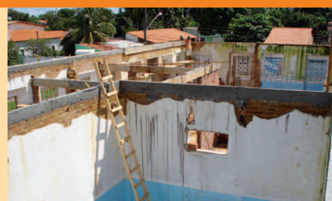
Maggio 2009. Copertura della struttura consolidata.