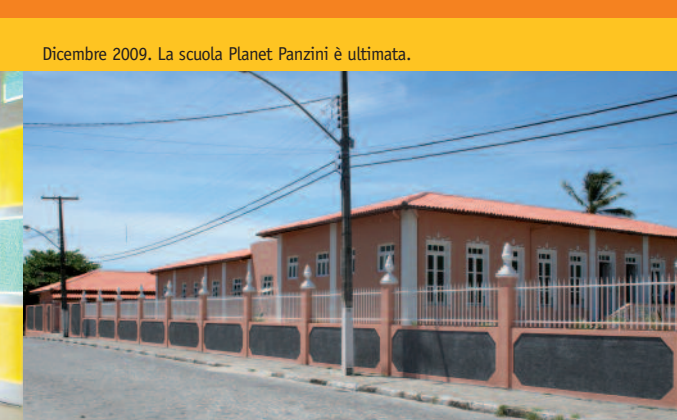
Dicembre 2009. La scuola Planet Panzini è ultimata.