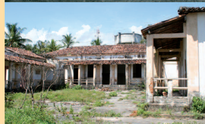
2008. L'ospedale in stato di degrado.