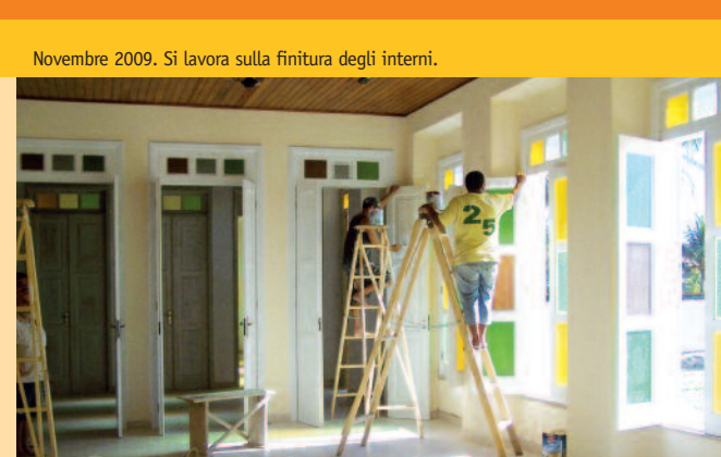
Novembre 2009. Si lavora sulla finitura degli interni.