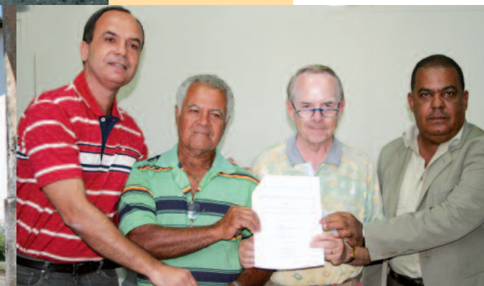
22 dicembre 2008. Município di Canavieiras. Accordo per il recupero del vecchio ospedale per il progetto Planet Panzini.