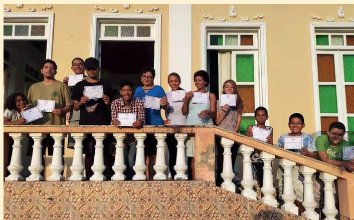
Alunni diplomati al corso di disegno artistico