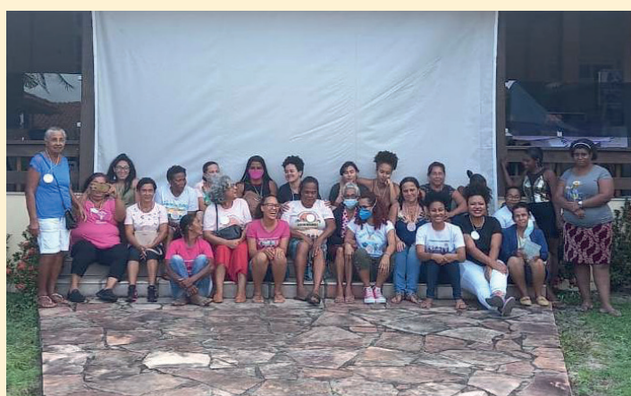
Incontro dell'associazione Donne pescatrici di Canavieiras