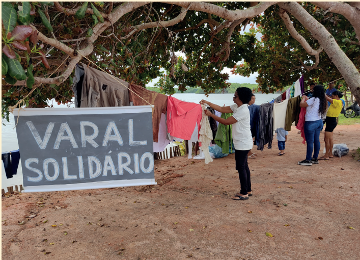
Lo stendino della solidarietà