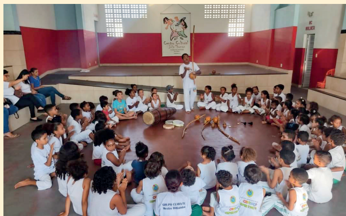
Corso di capoeira per bambini di altre scuole