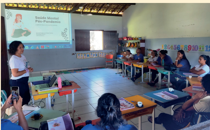
Dalla psicologa aiuto post-covid alle insegnanti