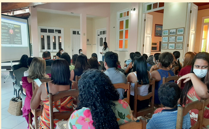
Seminario di formazione per gli insegnanti delle scuole di Canavieiras