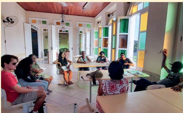
Gruppo teatrale di Canavieiras prova i testi