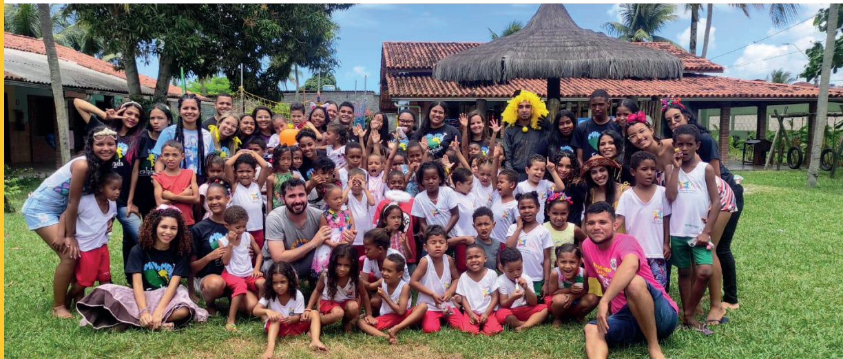
Giornata dell'infanzia con il Gruppo Giovanile Cattolico Escalada di Canavieiras