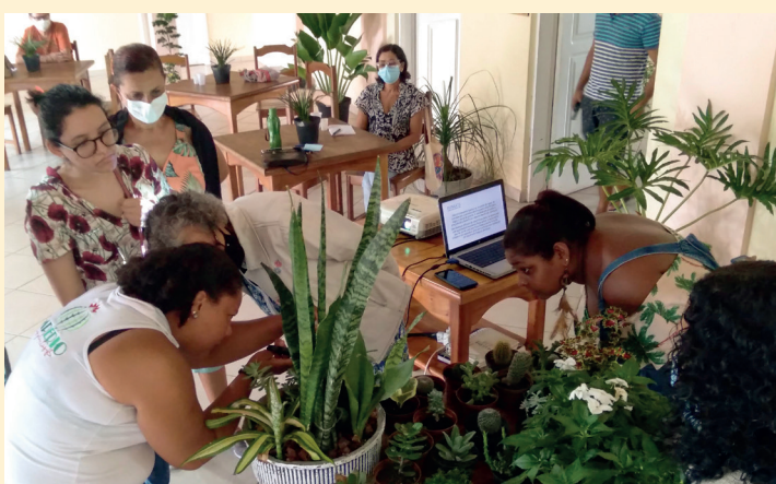
Corso di giardinaggio e floricultura