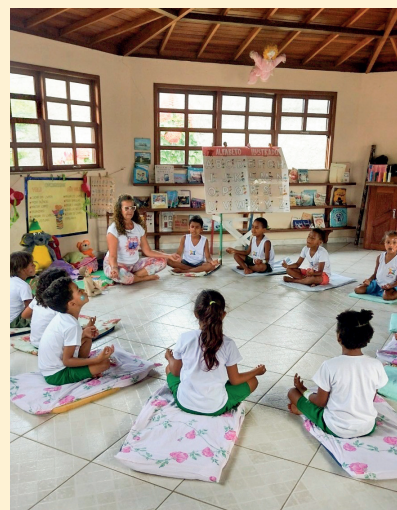
Attività in biblioteca