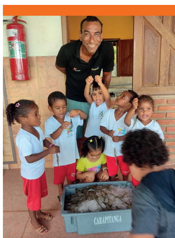
Donazione di gamberi - Associazione degli allevatori di gamberi di Canavieiras - ACCC