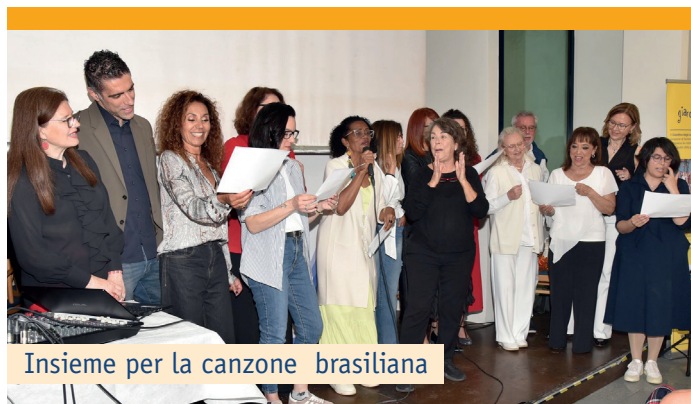
Insieme per la canzone brasiliana