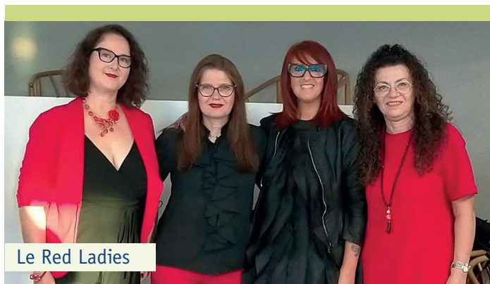
Le Red Ladies