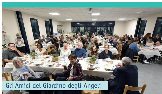
Gli Amici del Giardino degli Angeli