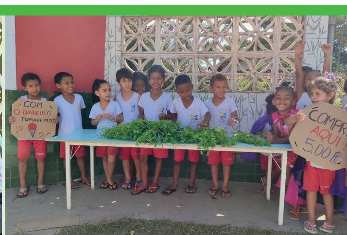
Nell'orto si impara che ogni seme piantato con cura si trasforma in un raccolto, in apprendimento e in nuove opportunità.