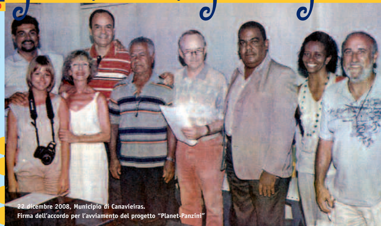
22 dicembre 2008, Municipio di Canavieiras. Firma dell'accordo per l'avviamento del progetto "Planet-Panzini"